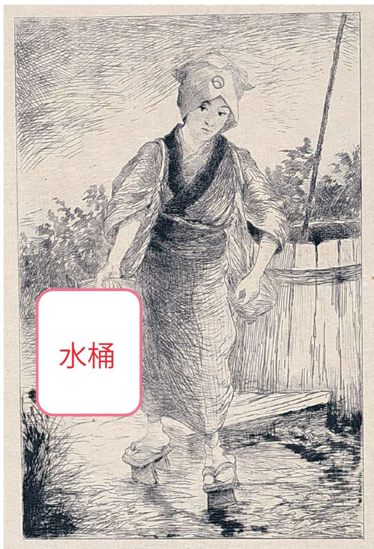
「クロッキー・ジャポネ」16 水汲み 市立伊丹ミュージアム蔵