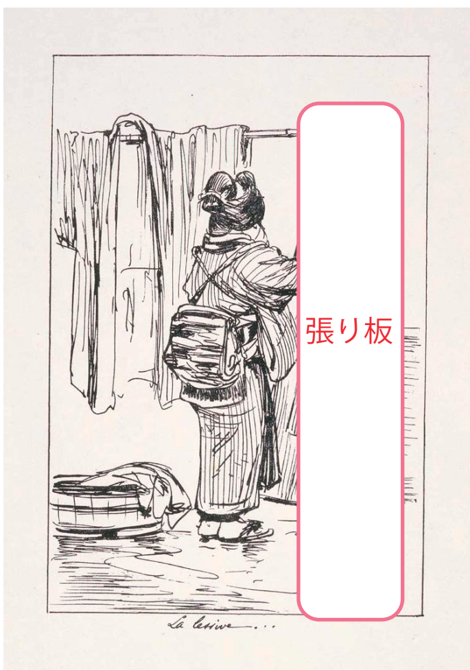
「クロッキー・ジャポネ」17 市立伊丹ミュージアム蔵