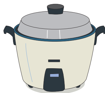
でんきすいはんき