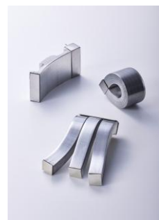
2023大賞 吉岡優希(よしおかゆうき) 「neo」 アルミニウムハニカム、シルバー、 ステンレス、マグネット

主催 市立伊丹ミュージアム [伊丹ミュージアム運営共同事業体/伊丹市] 協賛 株式会社光陽社、佐竹ガラス株式会社、株式会社田中直染料店 後援 兵庫県、一般社団法人総合デザイナー協会(DAS)、 公益社団法人日本ジュエリーデザイナー協会(JJDA)、 株式会社ベイ・コミュニケーションズ、伊丹まち未来株式会社