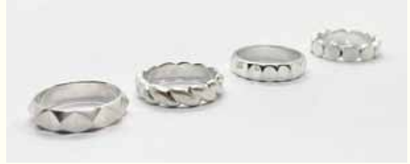
日常使いできるリングを作りましょう

持ち物：筆記用具、エプロン、電卓、定規(15cm程度)、油性マーカー(極細)、ハサミ、使い古しのハンカチ