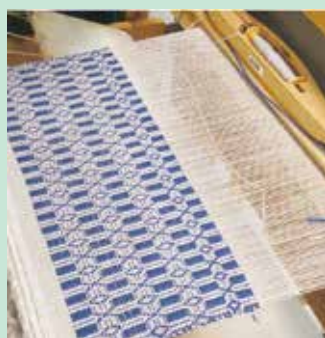
「フィンランドの組織織り」受講生作品