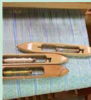
「花織り」受講生作品