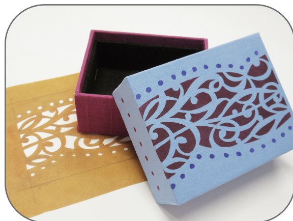
サイズ: たて8cm・よこ10cm・高さ4cm 数種類の型紙からお好きな柄を選んで彩色していただきます

展示室3 「モダンガールのたしなみとよそおい」 2023.9.8(金) - 10.22(日)