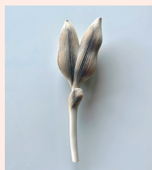
※参考作品 佐藤ミチヒロ