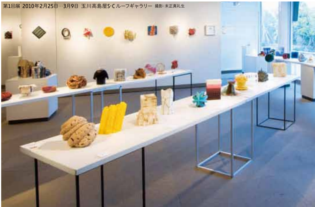
第1回展 2010年2月25日…3月9日 玉川高島屋S・Cルーフギャラリー