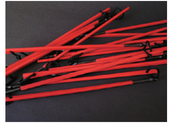
「割箸ジュエリー」 2005年

2007, 2011年 伊丹国際クラフト展「ジュエリー」入選 2012年 2012日本ジュエリーアート展 奨励賞