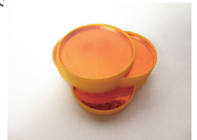
ブローチ「スペインの太陽」 2013年