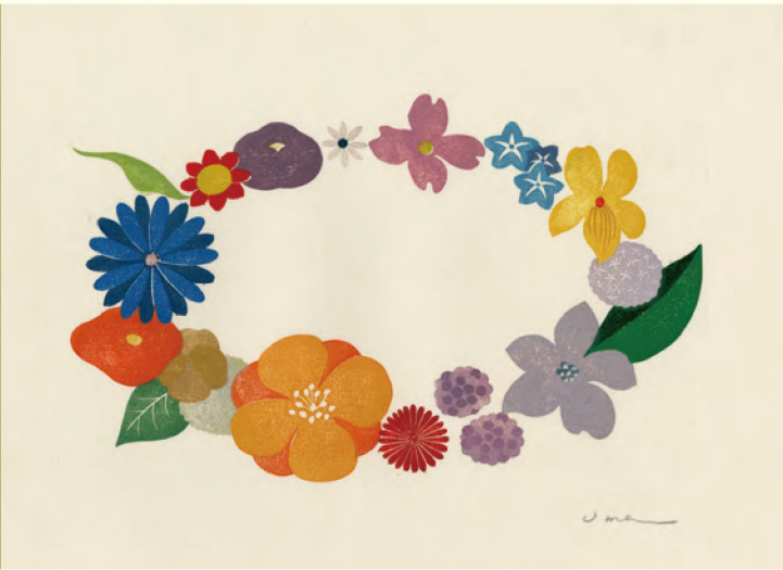
Ring | 木版 | 2009年 | 22.5×30cm