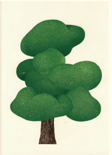
庭木さん | 木版 | 2015年 | 30×22.5cm