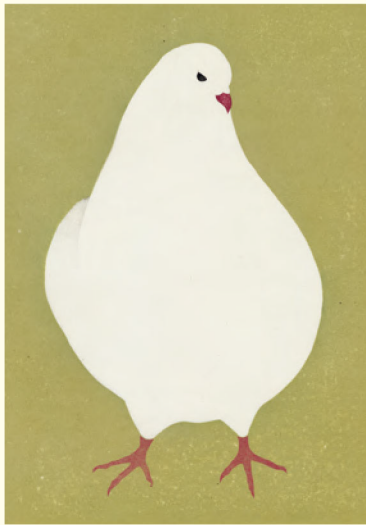
ハト | 木版 | 2006年 | 30×22.5cm