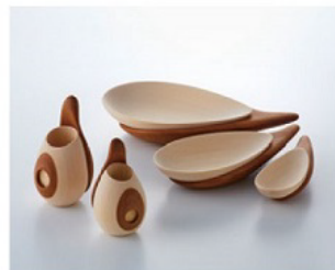
審査員賞：神山 和也 "樽雫(Kaidai)~Drops of Japanese cypress"

ものを創り表現する営為を支える第一のものは、作者の内から発する欲びを伴った衝動である。その衝動と欲びの強さを感じ取ることが、審査に当たらせてもらっている者の冥加なのだ。今回は、生の純粋な衝動と欲びが感じられる作品は多くなかったように思う。