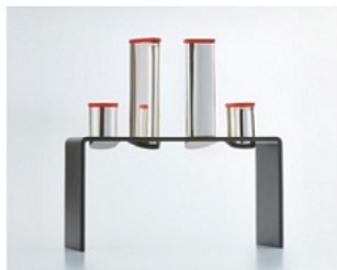
奨励賞(光陽社賞)：HANSEN Ragnar "The Heart Drinks Sake"