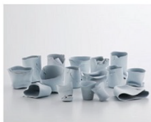
伊丹賞：LIN Chun "Waiting to be Fixed"