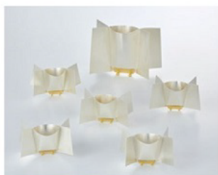
準大賞(白雪賞)：TU Cheng-Chieh "Sealed bag"