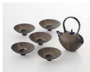
優秀賞(白雪・伊丹諸白賞)：清水 美由希 "袖-TUMUGI-"