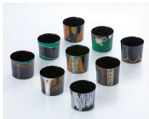
奨励賞(老松賞)：佐野 圭亮 "乾漆種器「いろいろ」"