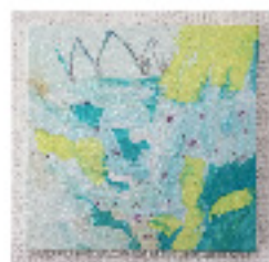
牧川美帆: water mirror