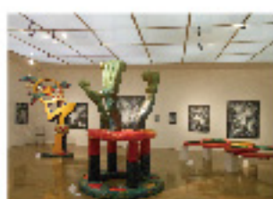
中西学: 漢家のふるまい