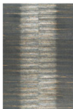
徳正明: 連続と不連続の境界