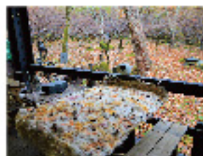
指田客史子: In the woods