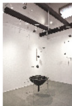
長谷川政弘: 「Lotus」 浮遊