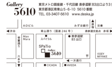
第4回展 2015年9月25日—10月3日 Gallery5610