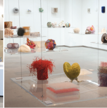
第1回展 2010年2月25日—3月9日 玉川高島屋S・C ルーフギャラリー