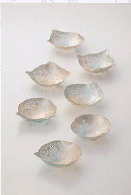
2014年大賞 WU Ching-Chih (台湾) 《The Trace of Rainwater》