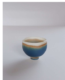
石田彩《硝子冷茶碗「Tea ceremony」》