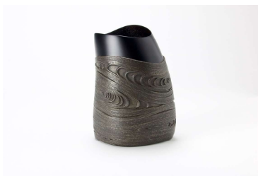
野口健《乾漆線紋花入「Sawing Vessel 42」》