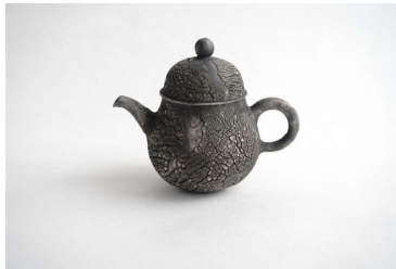
色原昌希《刻黒茶壺》