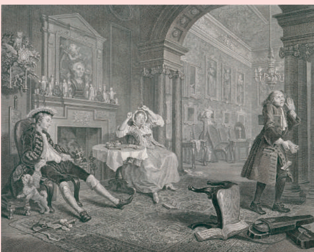
ウィリアム・ホガース《当世風結婚》第2図 | 1743年 | 銅版画 | 市立伊丹ミュージアム蔵