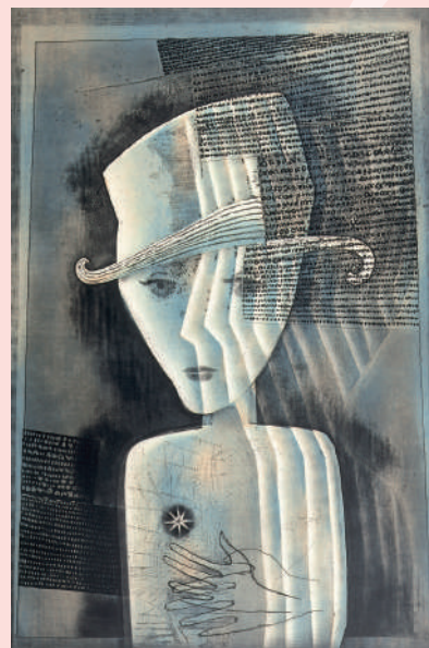
深沢幸雄《印象(美しい若者)》| 1997年 | 銅版画 | 市立伊丹ミュージアム蔵