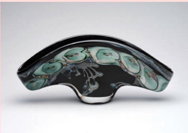
ルイ・レル《孔雀の羽根》| 1992年 | ガラス | 市立伊丹ミュージアム蔵