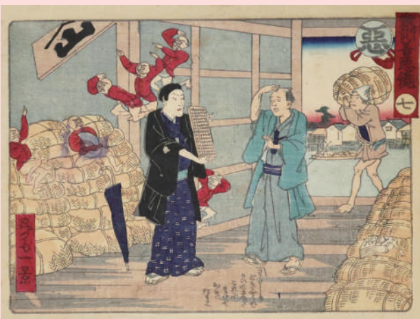
昇斎一景《教訓善悪鏡》より七「悪」| 明治5年(1872) | 錦絵 | 市立伊丹ミュージアム蔵