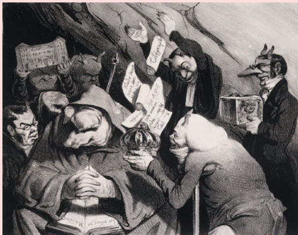
オノレ・ドーミエ《誘惑》| 1834年 | リトグラフ | 市立伊丹ミュージアム蔵