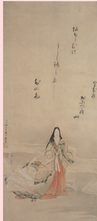
上島鬼貫：賛、大岡春卜：画「あちらむけ」句画賛 享保20年頃(1735) | 紙本着色 | 公益財団法人柿衛文庫蔵