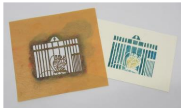
鳴く虫とクラフトコーナー(イメージ)