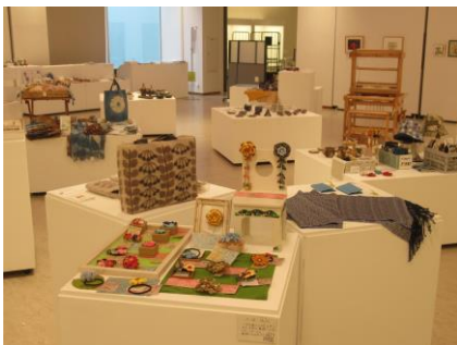
昨年のクラフトフェアの様子