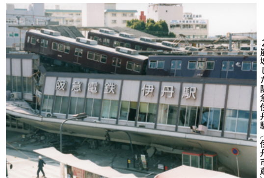
2 崩壊した阪急伊丹駅

また震災は、民家等に残されていた数多くの歴史資料が散逸するという事態を生みました。旧伊丹市立博物館は震災後、地域の方々に協力していただきながら、民家等の歴史資料調査を進める「旧村調査」をスタートさせました。そして調査で得た成果を、この度の「旧村シリーズ」といった展示などを通して、市民のみなさまに広く周知しています。シリーズ16回目となる今回の展示では、猪名川左岸に位置する、岩屋地区・森本地区を取り上げます。