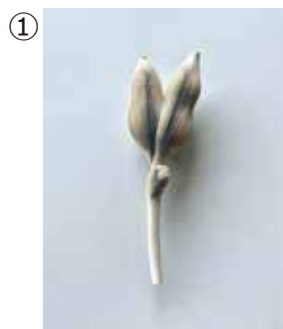
① 佐藤ミチヒロ ブローチ ※参考作品