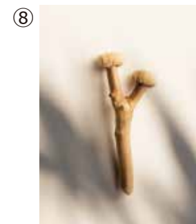
⑧ 青木愛実 《榊いれる木-Type Branch-》 ©Yasuhiro Iizuka ブローチ ※参考作品