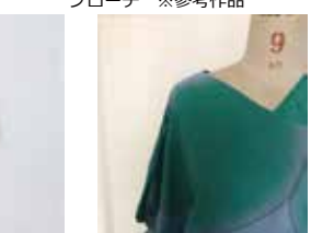
⑫ 特別出品 fujii+fushikino 《モスリンの服_SC》 ※参考作品