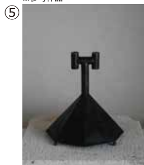
⑤ 庄田真弓 香炉