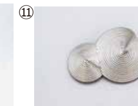
⑪ 平川文江 ブローチ