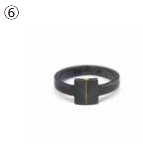
⑥ 三島一能 《traces "seam of the ring"》 リング