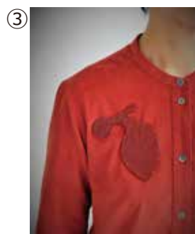
③ 浜口昌子 《Titania》 ©Peter Crush