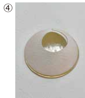
④ 山本あき 《Scale uroko》ブローチ