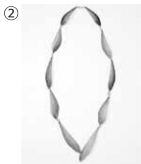
② 竹内美玲 ネックレス