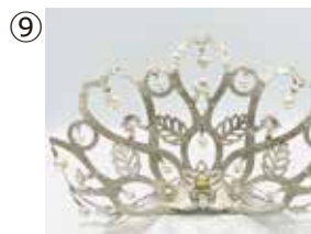
⑨ 菊地ルイ ティアラ